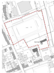
Clausewitzstr Flurkarte mit Kontur.jpg