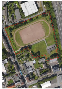
Clausewitzstr Orthofoto mit Kontur.jpg