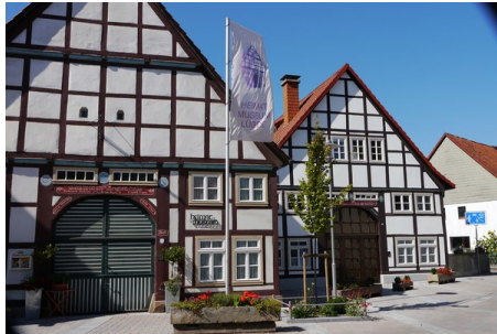
Altstadt mit Heimatmuseum.jpg