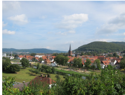
Blick auf die Altstadt von Lügde.jpg