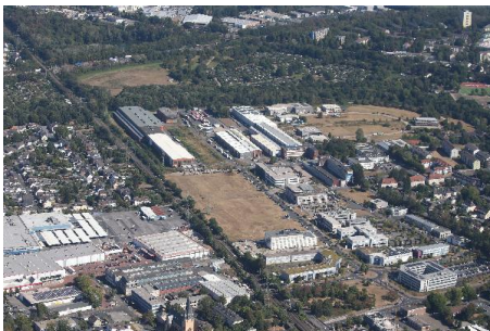
Luftbild IPL unter 5MB.JPG