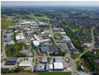
Industriegebiet 170828 (18).JPG