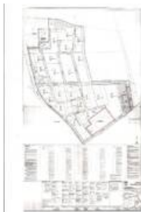
BPlan GG Hackenbroich Gesamt.jpg