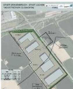
Elsbachtal: Potenzielle Flächen als Platzhalter