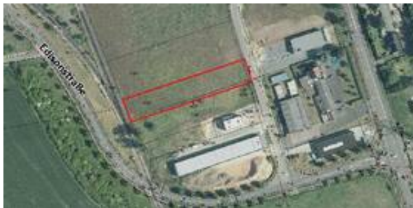
Verfügbare Flächen Borsigstraße.jpg