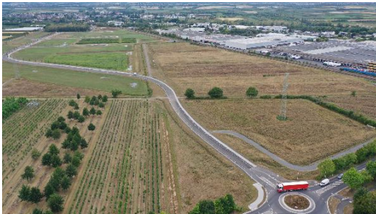
Luftbild Unternehmerpark Kottenforst.jpg