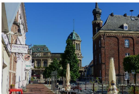
Altstadt Rheinberg