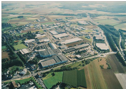
Luftbildaufnahme Gewerbegebiet Aachener Kreuz