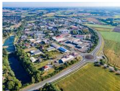
Blick auf das Gewerbegebiet Olfen-Hafen