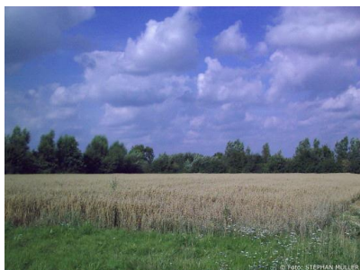
Grundstück neben GLS