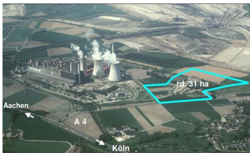
Industriegebiet Am Grachtweg