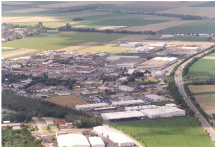
Luftaufnahme Gewerbegebiet Niederheid