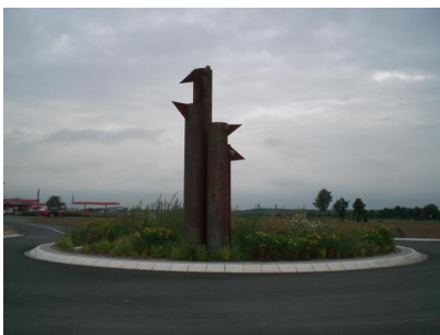
Gewerbegebiet "An der Römerallee"