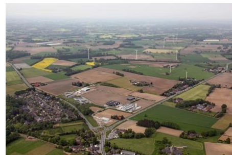
Luftbildansicht Gewerbegebiet Holtwick