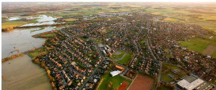
Blick auf die Stadt Olfen. Am linken Bildrand: Die Steveraue

Dass dies bei den Verantwortlichen in den Unternehmen geschätzt wird, zeigt das stetige Wachstum der Olfener Gewerbegebiete in den vergangenen Jahren. Auch die Zahl der sozialversicherungspflichtigen Arbeitsplätze konnte seit 1999 um 37,5 % gesteigert werden.