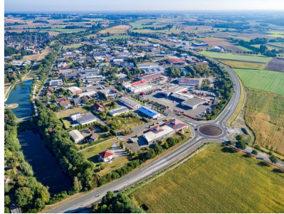
Blick auf das Gewerbegebiet Olfen-Hafen