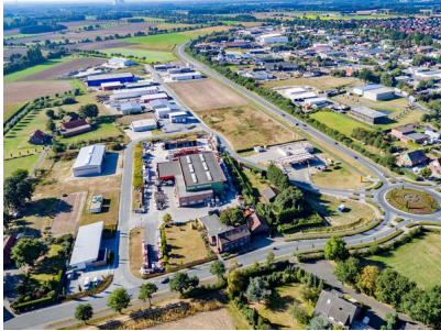
Blick auf das Gewerbegebiet Olfen-Ost. Im Hintergrund: