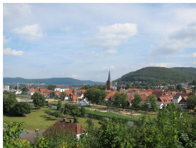
Blick auf die Altstadt von Lügde.jpg