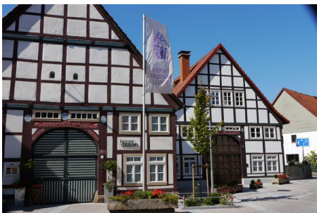
Altstadt mit Heimatmuseum.jpg