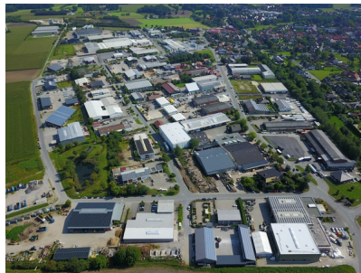
Industriegebiet 170828 (17).JPG