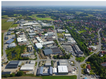
Industriegebiet 170828 (18).JPG