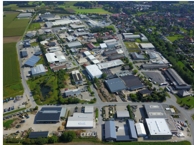
Industriegebiet 170828 (17).JPG