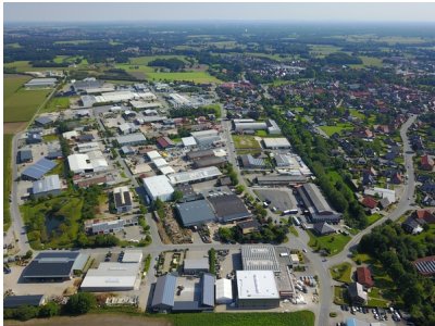
Industriegebiet 170828 (18).JPG