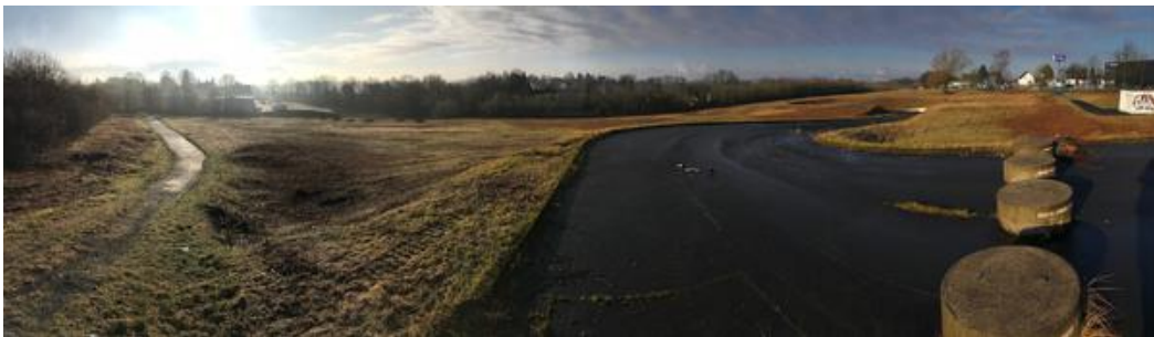
2018_01_13_GE Fürkeltrath I_Pano.jpg