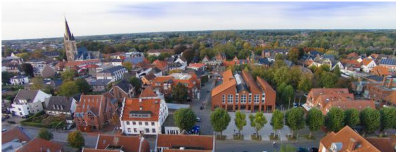
Gescher hat ein attraktives Zentrum.

In der Nähe befindet sich der IT-Campus, auf dem die zentralen Einrichtungen (z. B. Kantine) mitgenutzt werden können.