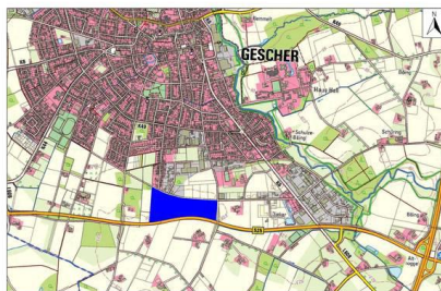
Das Gebiet liegt im Süden des Stadtgebietes der Glockenstadt