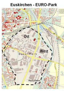
EURO-Park mit Straßennamen