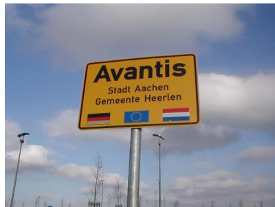
Verdoppeln Sie Ihre Chancen mit AVANTIS!