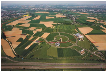
Grenzenlose Möglichkeiten auf AVANTIS!