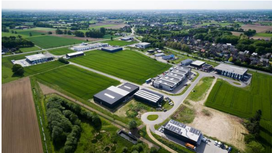
Luftbildansicht Gewerbegebiet Holtwick