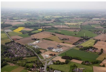
Luftbildansicht Gewerbegebiet Holtwick