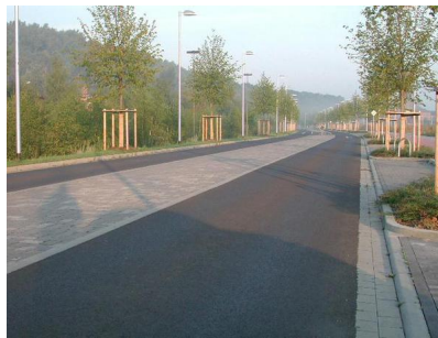
Konrad Adenauer-Straße in Alsdorf