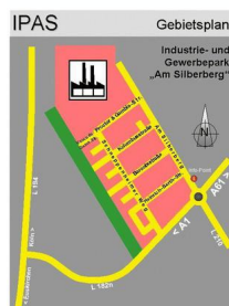
IPAS - Übersicht mit Straßennamen