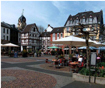
Alter Markt, Euskirchen