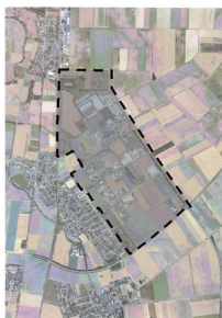
IPAS (Industrie- und Gewerbepark "Am Silberberg")