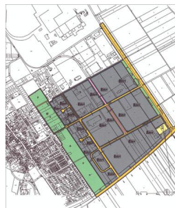
IPAS - Bebauungsplan Nr. 10 (1. Änderung)