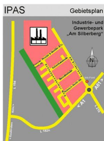
IPAS - Übersicht mit Straßennamen