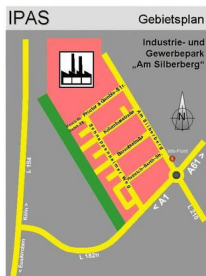
IPAS - Übersicht mit Straßennamen