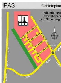
IPAS - Übersicht mit Straßennamen