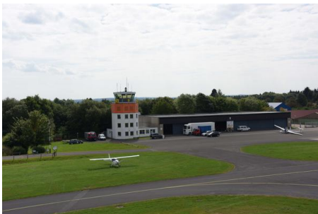
Flugplatz Dahlemer Binz