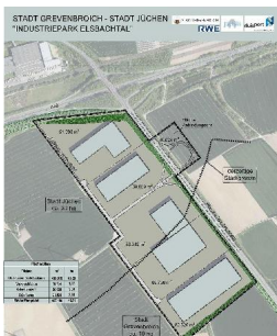
Elsbachtal: Potenzielle Flächen als Platzhalter