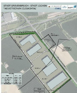
Elsbachtal: Potenzielle Flächen als Platzhalter