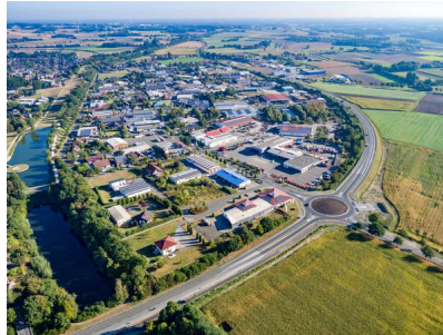
Blick auf das Gewerbegebiet Olfen-Hafen