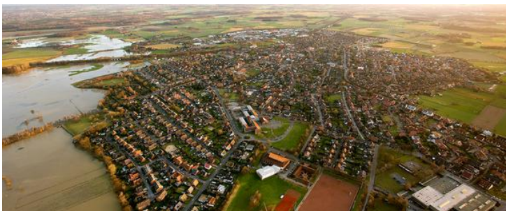
Blick auf die Stadt Olfen. Am linken Bildrand: Die Steveraue

Dass dies bei den Verantwortlichen in den Unternehmen geschätzt wird, zeigt das stetige Wachstum der Olfener Gewerbegebiete in den vergangenen Jahren. Auch die Zahl der sozialversicherungspflichtigen Arbeitsplätze konnte seit 1999 um 37,5 % gesteigert werden.