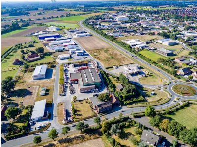
Blick auf das Gewerbegebiet Olfen-Ost. Im Hintergrund: