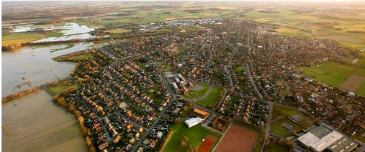
Blick auf die Stadt Olfen. Am linken Bildrand: Die Steveraue