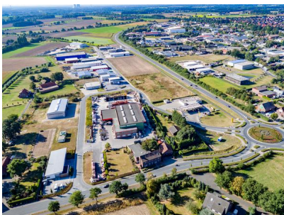
Blick auf das Gewerbegebiet Olfen-Ost. Im Hintergrund:

Dass dies bei den Verantwortlichen in den Unternehmen geschätzt wird, zeigt das stetige Wachstum der Olfener Gewerbegebiete in den vergangenen Jahren. Auch die Zahl der sozialversicherungspflichtigen Arbeitsplätze konnte seit 1999 um 37,5 % gesteigert werden.