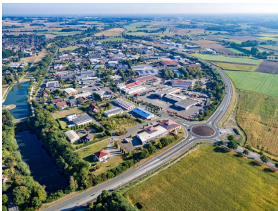
Blick auf das Gewerbegebiet Olfen-Hafen