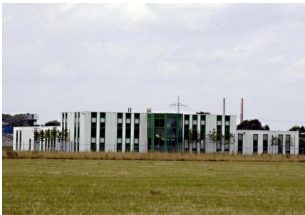
Gewerbe- und Industriegebiet Dremmen