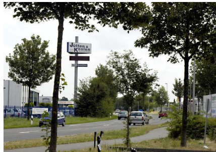
Gewerbe- und Industriegebiet Dremmen