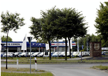
Gewerbe- und Industriegebiet Dremmen