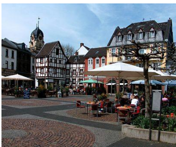
Alter Markt, Euskirchen