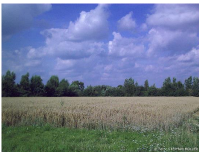
Grundstück neben GLS