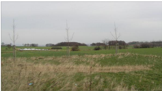
Geplantes Gewerbegebiet Gey