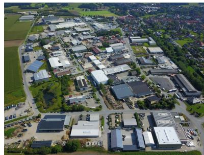
Industriegebiet 170828 (17).JPG