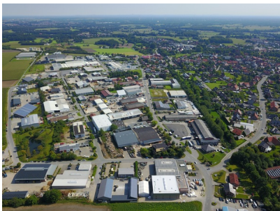
Industriegebiet 170828 (18).JPG

Besonderheiten Nutzung Anmerkung: Zulässige Abstandsklassen IV-VII (500 m zur nächsten Wohnbebauung)