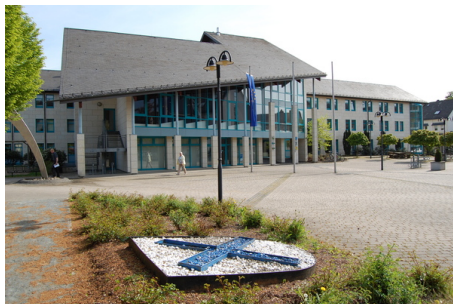
Rathaus mit Wappen.JPG

Der an der Ruhr und am Rande des Arnsberger Waldes liegende Ort war im 14. Jahrhundert ein Kleinweiler mit einem Doppelhof des Stiftes Meschede und einem Hof des Klosters Grafschaft. Nach dem Bau eines Bahnhofs an der Oberen Ruhrtalbahn entwickelte sich der Weiler in der zweiten Hälfte des 19. Jahrhunderts zu einer Eisenbahnergemeinde. Zudem führte der Bergbau in der damaligen Nachbargemeinde Ramsbeck zum Anwachsen der Einwohnerzahl. Die Gemeinde Bestwig entstand in ihrer heutigen Form erst im Zusammenhang mit der kommunalen Neugliederung von Nordrhein-Westfalen im Jahr 1975. Durch sie wurden stark gewerblich oder noch bergbaulich orientierte Gemeinden mit überwiegend landwirtschaftlich geprägten Orten zusammengelegt.