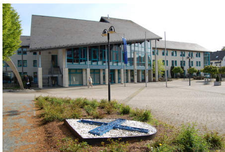
Rathaus mit Wappen.JPG

Der an der Ruhr und am Rande des Arnsberger Waldes liegende Ort war im 14. Jahrhundert ein Kleinweiler mit einem Doppelhof des Stiftes Meschede und einem Hof des Klosters Grafschaft. Nach dem Bau eines Bahnhofs an der Oberen Ruhrtalbahn entwickelte sich der Weiler in der zweiten Hälfte des 19. Jahrhunderts zu einer Eisenbahnergemeinde. Zudem führte der Bergbau in der damaligen Nachbargemeinde Ramsbeck zum Anwachsen der Einwohnerzahl. Die Gemeinde Bestwig entstand in ihrer heutigen Form erst im Zusammenhang mit der kommunalen Neugliederung von Nordrhein-Westfalen im Jahr 1975. Durch sie wurden stark gewerblich oder noch bergbaulich orientierte Gemeinden mit überwiegend landwirtschaftlich geprägten Orten zusammengelegt.